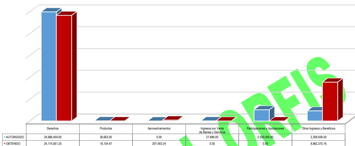
Gráfico 1. Ingresos

Nota: En la cuenta Otros Ingresos y Beneficios se incluyó las cuentas de impuestos, contribuciones por mejoras y otras aportaciones.